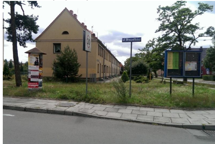
Fot. 9. Skwer przy skrzyżowaniu ulic Piotra Skargi i Bławatków