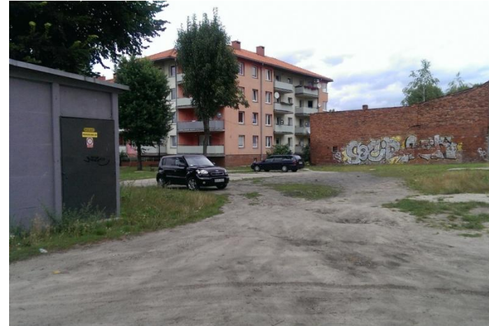
Fot. 12. Podwórko na osiedlu pomiędzy ul. Dąbrowskiego a Bałtycką