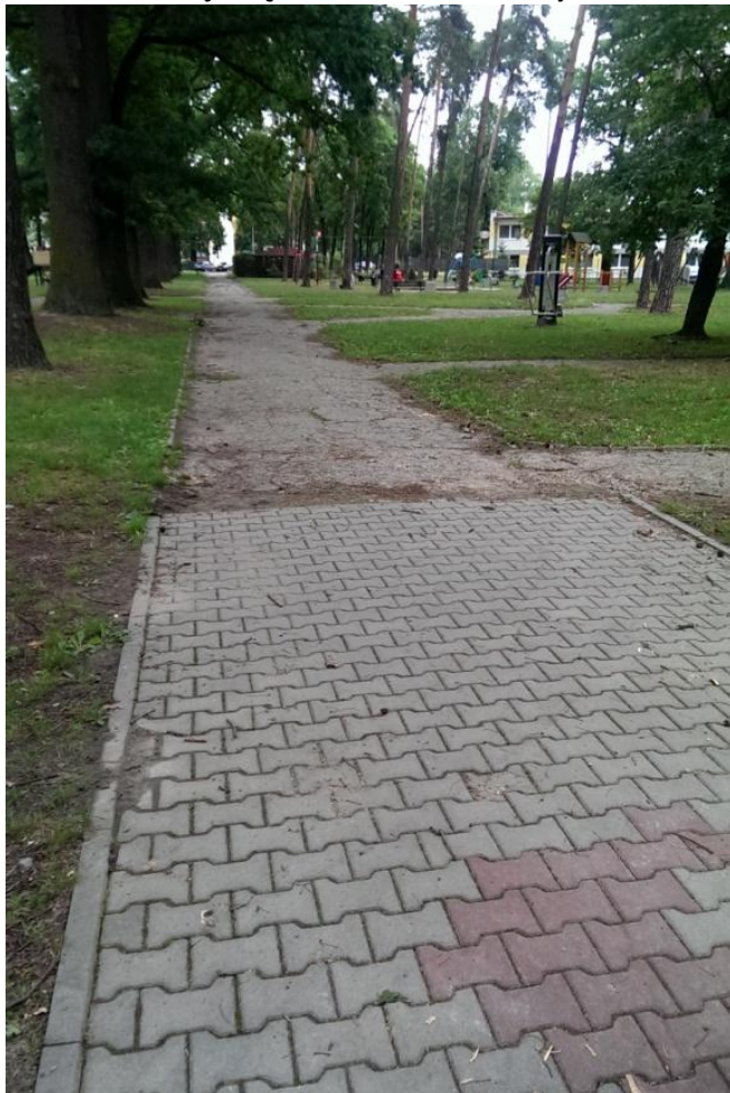
Fot. 5. Park Aleja Dębów – niedokończony chodnik