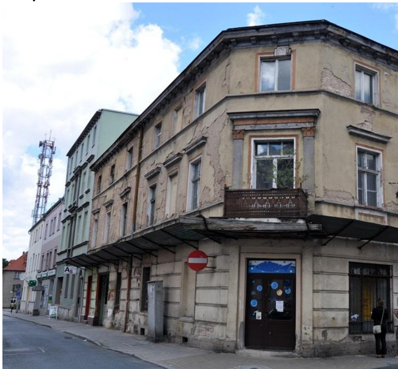
Fot. 17. Zniszczony budynek na skrzyżowaniu ul. Piramowicza i Anny