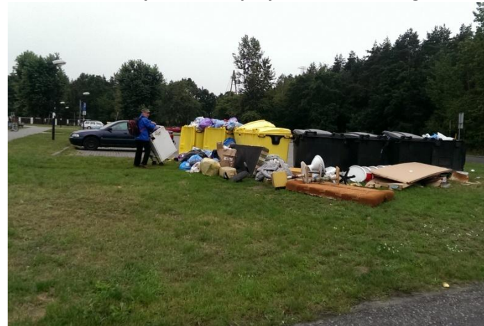
Fot. 2. Kontenery na śmieci przy ul. Broniewskiego 25