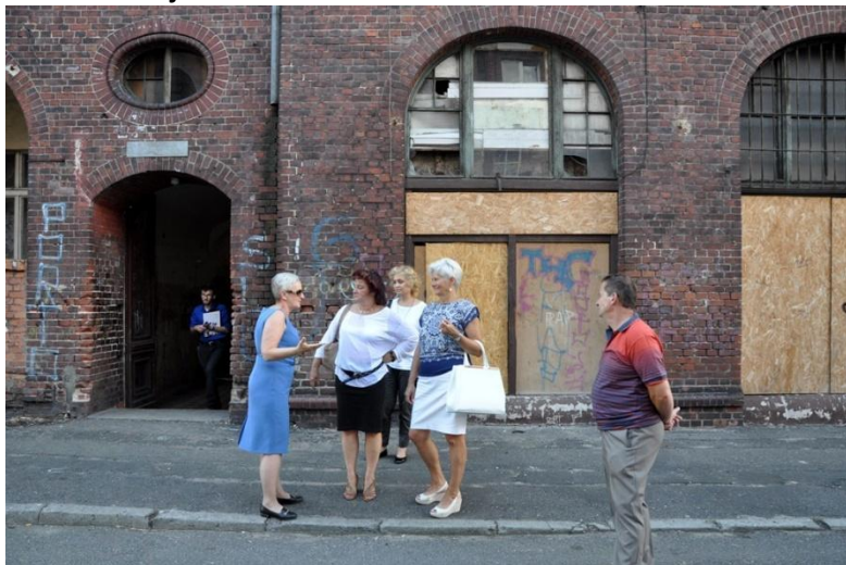
Fot. 22. Dyskusja uczestników spaceru przed budynkiem na ul. Pocztovej