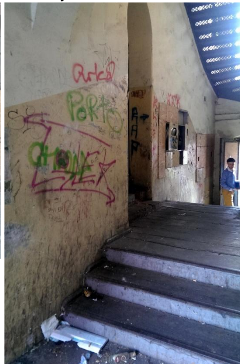
Fot. 23. Korytarz budynku przy ul. Pocztovej 7