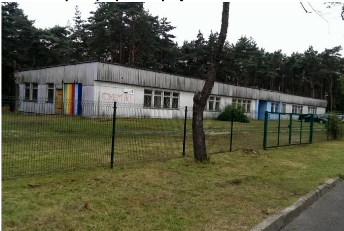
Fot. 3. Budynek przy ul. Zwycięstwa 17