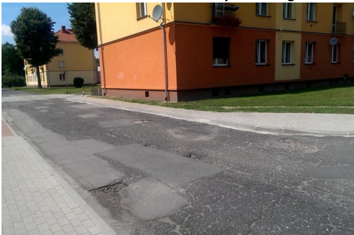
Fot. 27. Zniszczona nawierzchnia ulicy Grabskiego