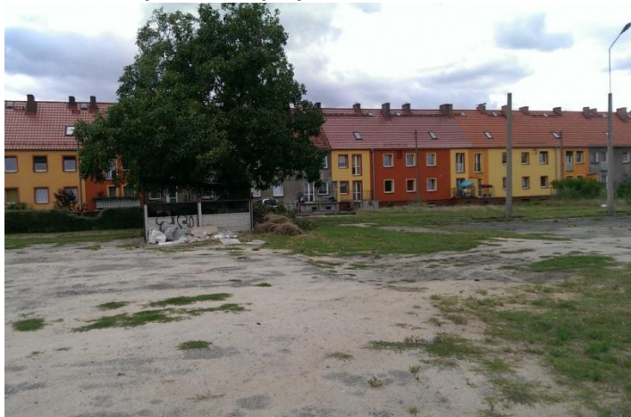
Fot. 8. Teren podwórka przy ul. Mickiewicza 16-18