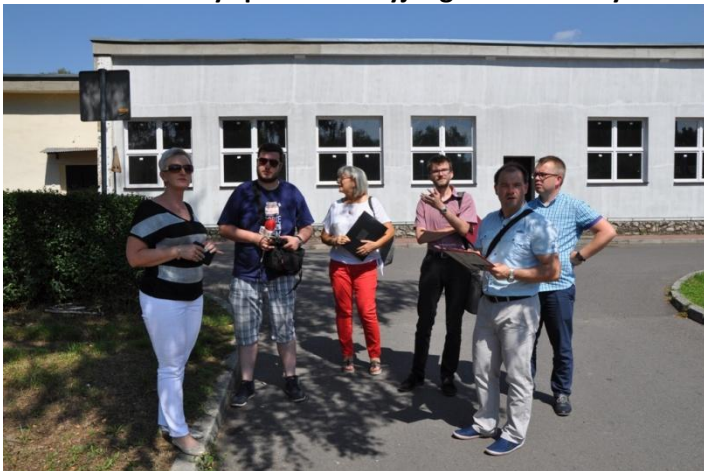
Fot. 29. Uczestnicy spaceru studyjnego na os. Azoty