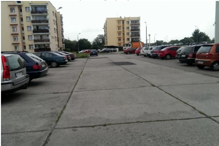
Fot. 1. Nawierzchnia parkingu przy ul. Tuwima 6