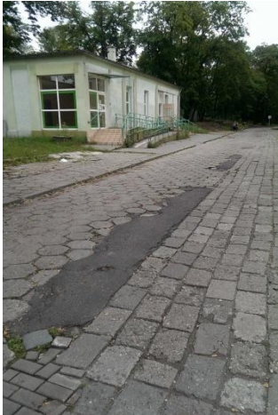
Fot. 11. Boczna odnoga ul. Doktora Judyma przy szpitalu