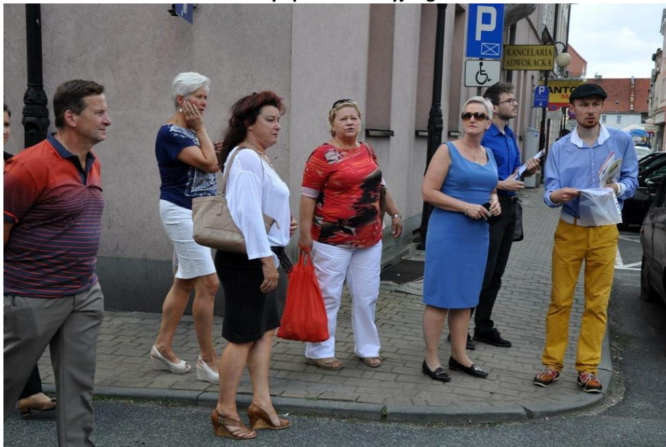
Fot. 15. Stare Miasto – uczestnicy spaceru studyjnego