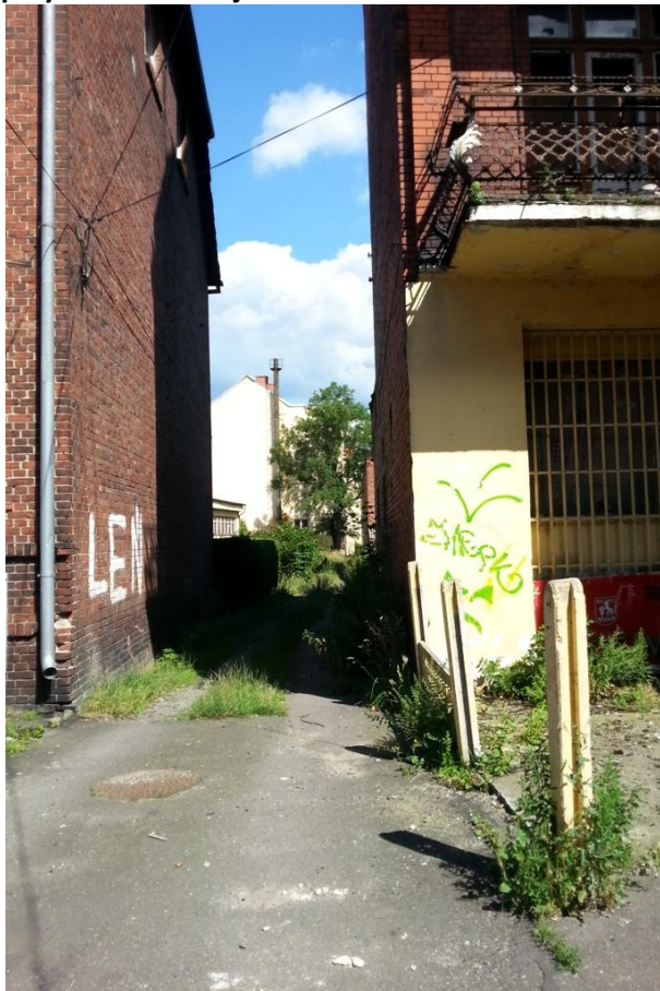
Fot. 20. Nietwardzona nawierzchnia drogi prowadzącej na podwórko przy ul. Pocztovej 4