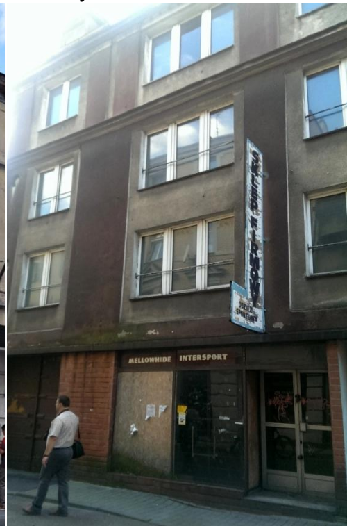
Fot. 18. Pusty lokal w budynku przy ul. Złotniczej 3