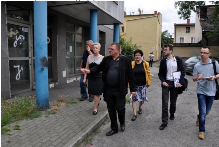
Fot. 13. Spacer studyjny po osiedlu Śródmieście