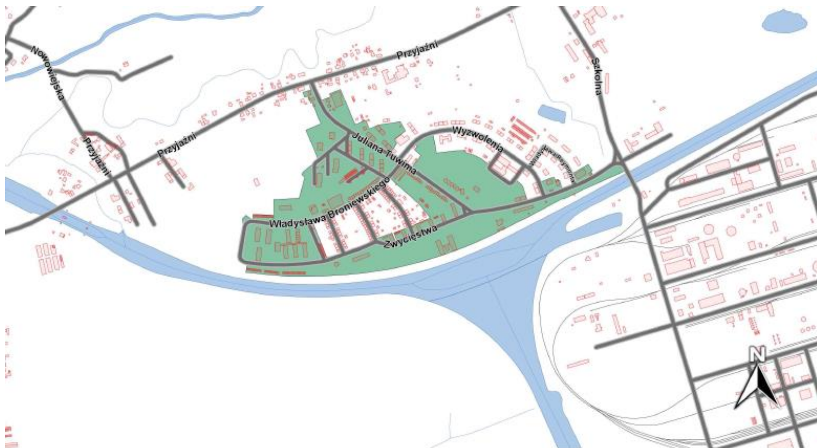
Mapa 3. Podobszar rewitalizacji Blachownia