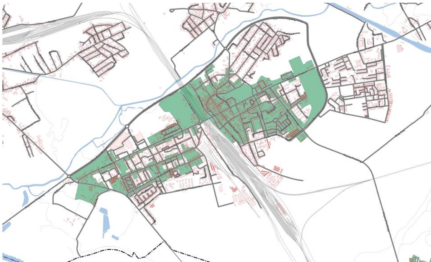
Mapa 2. Podobszar rewitalizacji Centrum