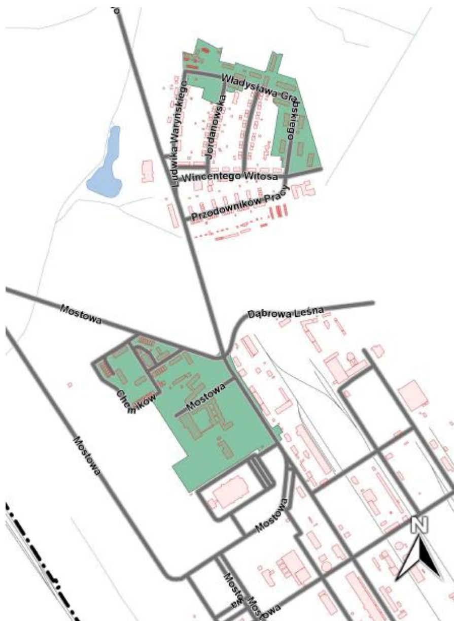
Mapa 4. Podobszar rewitalizacji Azoty